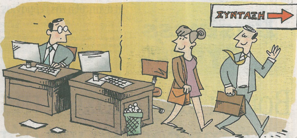
ΕΙΚΟΝΟΓΡΑΦΗΣΗ ΚΩΣΤΑΣ ΣΚΛΑΒΕΝΙΤΗΣ