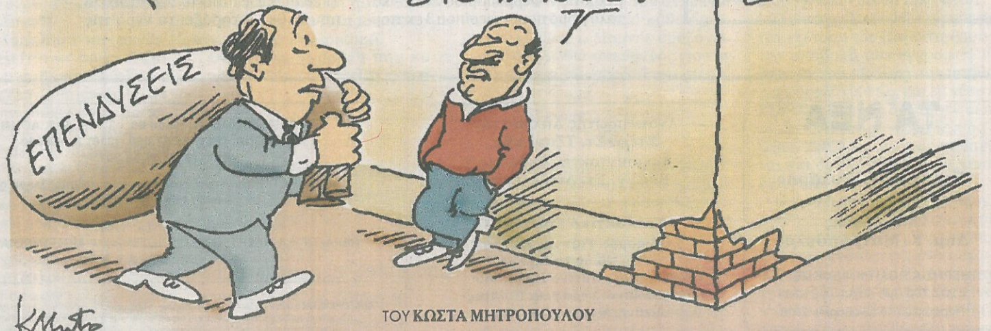
ΤΟΥ ΚΩΣΤΑ ΜΗΤΡΟΠΟΥΛΟΥ